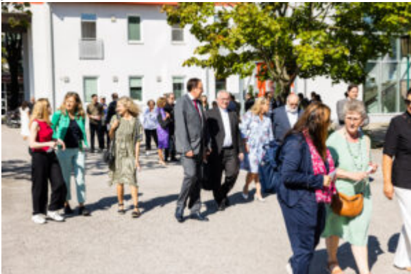
Großer Ansturm zum Festzelt vor dem Festakt.

Wir danken allen Wohnbauträgern für ihren Besuch