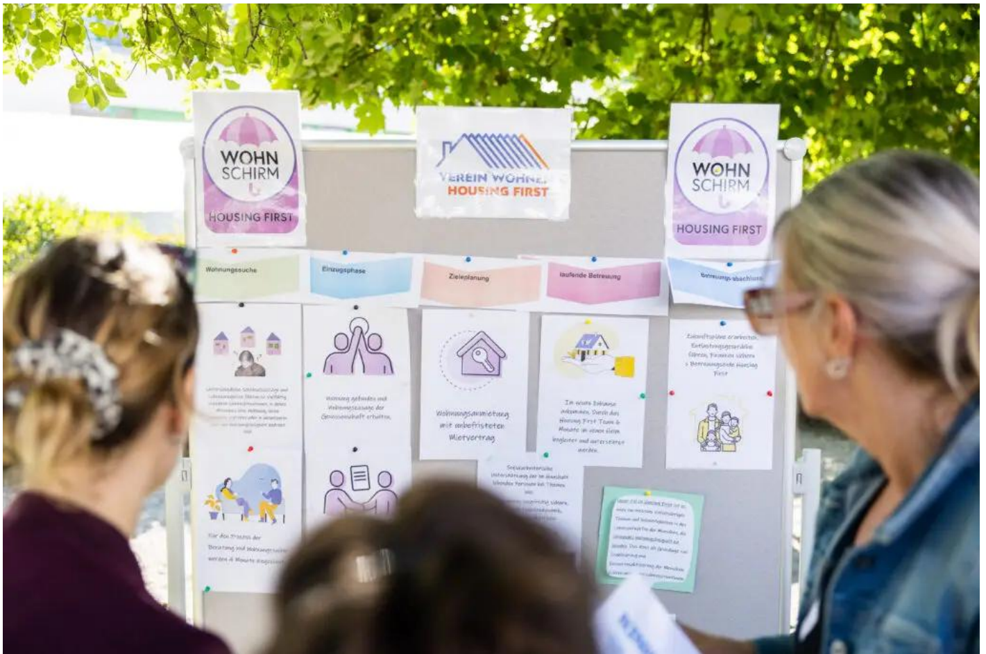
Der Informationsstand vom Wohnschirm Housing First.