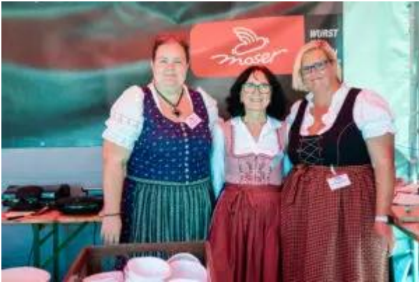
Unsere Mitarbeiterinnen am Buffet.